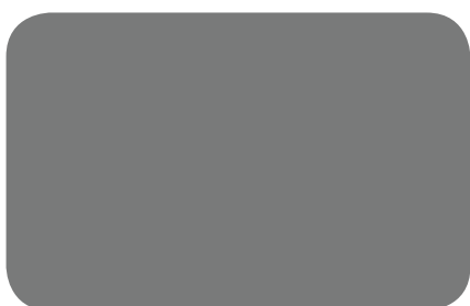
05 Silver Ion